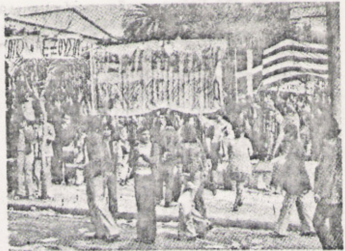
Στιγμιότυπο από το Πολυτεχνείο την πέμπτη 15/11. Διακρίνεται το σύνθημα ΚΑΤΩ Η ΕΞΟΥΣΙΑ, στη πόλη.

Στις 2 το μεσημέρι η κυβέρνηση απαντά στη Σύγκλητο ότι θα σεβαστεί το απαραβίαστο του Πανεπιστημιακού άσλου. Σε εκδηλώσεις συμπάραστασης κατεβαίνουν οι φοιτητές του πανεπιστημίου της Πάτρας και